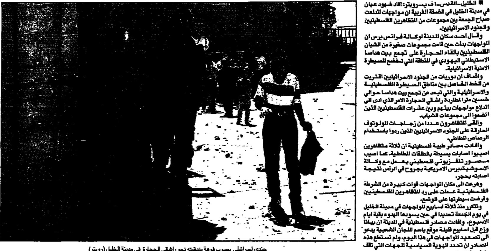
جندي إسرائيلي يصبوب فرقة بتفقيته تحرق رافعي الحجارة في مدينة الخليل